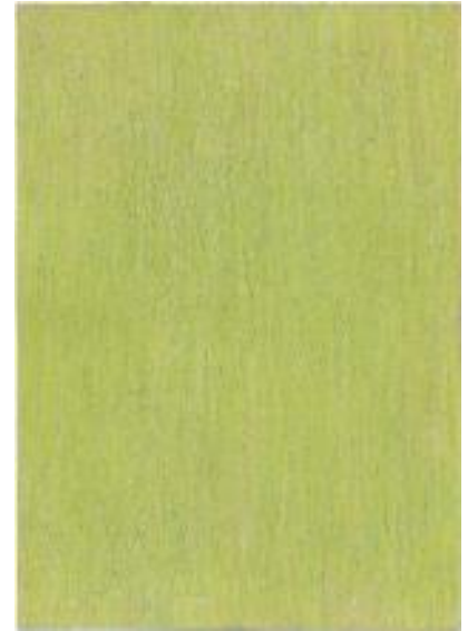
„Besonderes Licht2, 2015 „Sommer“, 2014 „Wiese im September“ 2013 Ölpastell auf Karton je 42 x 30cm