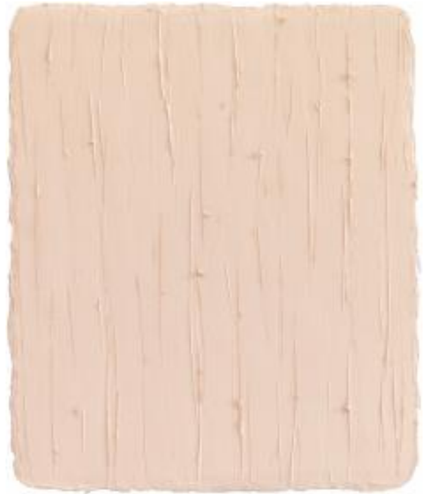
reche Seite „Rot-Ahorn“ 2016 Öl auf Leinwand 140 x 130 cm