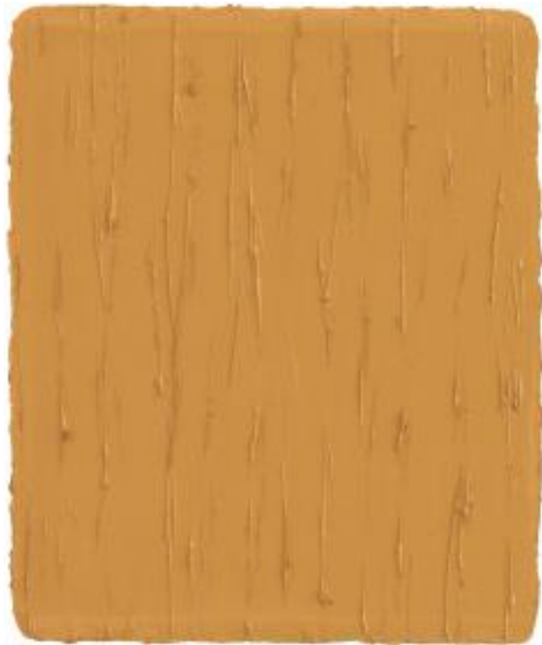
„Herbstlich“ 2012 „Apricot“ 2013 Öl auf Leinwand je 31 x 26 cm