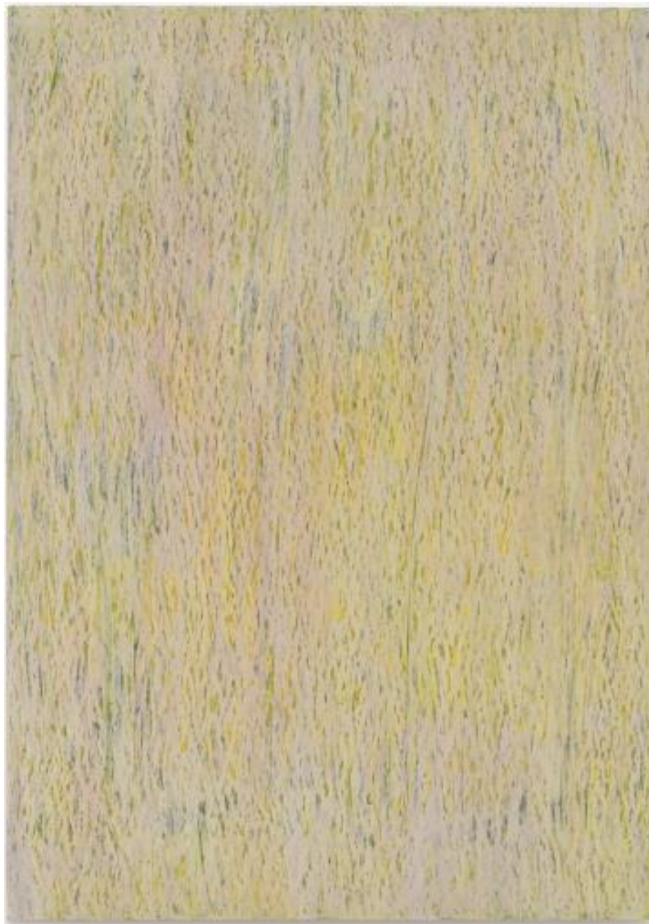
„August“ 2010 Ölpastell auf Karton 142x 30 cm